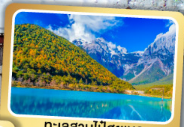
ทะเลสาบไป๋สยเหอ