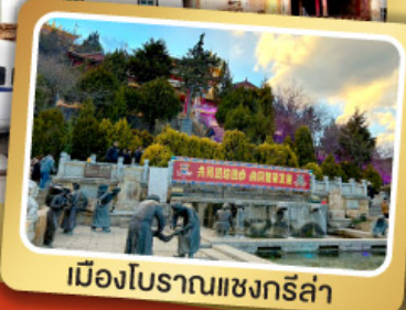
เมืองโบราณแชนกรีล่า