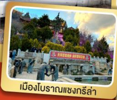
เมืองโบราณแชงกรี่ล่า