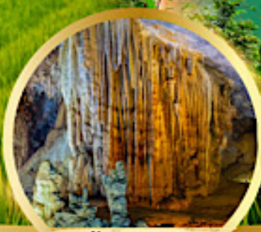
น้ำสวรรค์