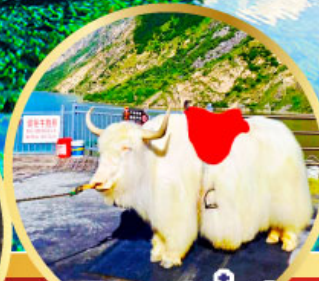
ทะเลสาปเตี้ยซี