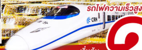
เริ่มต้น