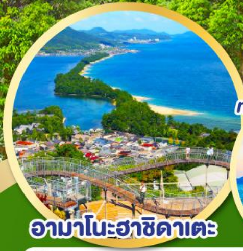
อามาโนะฮาซิดาเตะ