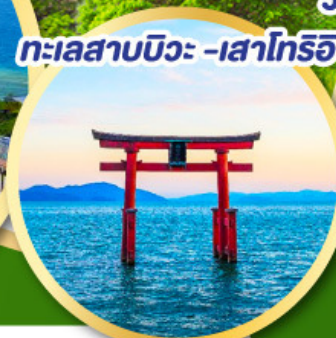
ทะเลสาบบิวะ -เสาโทริอิ