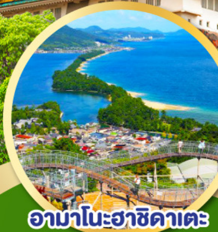
อามาโนะฮาซิดาเตะ