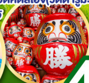
วัดคัตสึโฮจิ(วัดดาร์มะ)