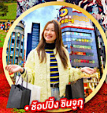
• ช้อปปิ้ง ซินจูกุ

กิจกรรมใส่ชุดกิโมโน พร้อมชมโชว์การแสดงต่างๆ