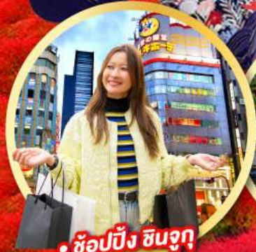
• ช้อปปิ้ง ชินจูกุ

กิจกรรมใส่ชุดกิโมโน พร้อมชมโชว์การแสดงต่างๆ