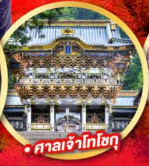
• ศาลเจ้าโทโฮกุ