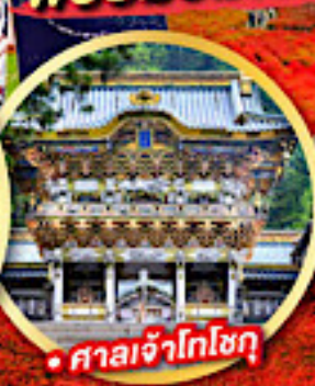
• ศาลเจ้าโทโชกุ