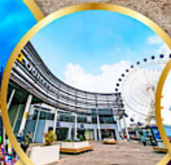
มิตซูเอากะไลท์พาร์ค เซนได