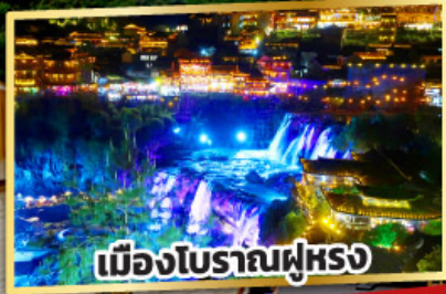
เมืองโบราณฟูหรง