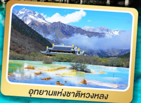
อุทยานแห่งชาติหลงหล่ง