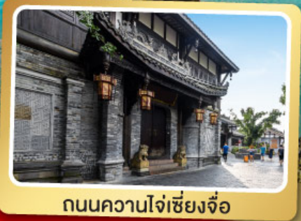
ถนนควานโจ๋เซียงจื่อ