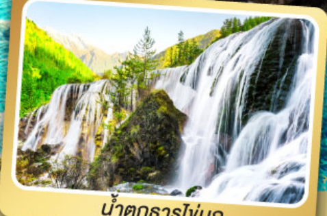
น้ำตกธารโง่บูก

ชมโชว์เปลี่ยนบุหน้ากาก เมนูพิเศษ สุกัหม่าล่าเสฉวน