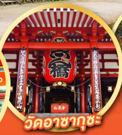
วัดอาซากุซะ