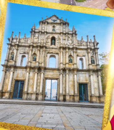
วิหารเซนต์ปอลเซนต์ปอล