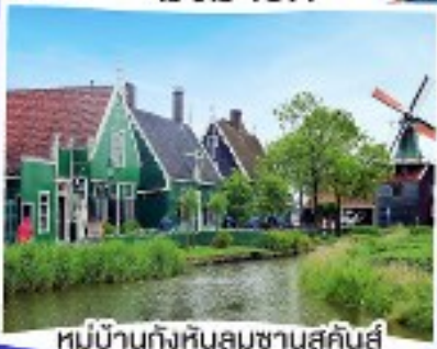
หมู่บ้านกังหันลมซานสคีนส์