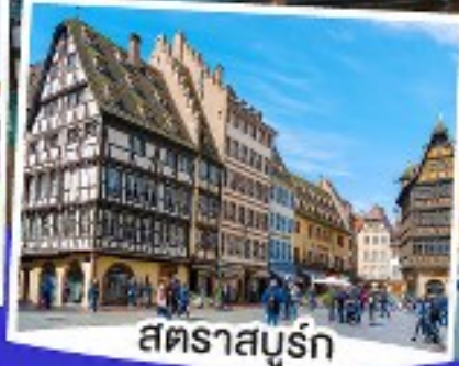
สตราสบูร์ก