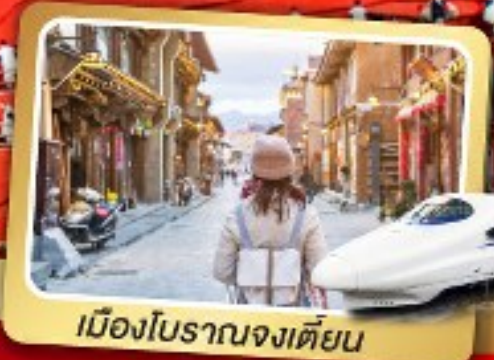
เมืองโบราณจงเตี้ยน