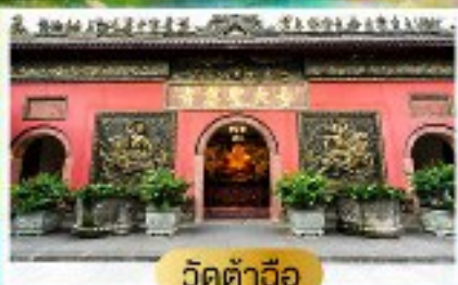
วัดต้าอ้อ