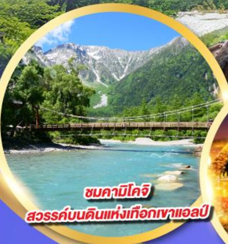
ชมคามิโคจิ สวรรค์บนดินแห่งเทือกเขาแอลป์

นั่งกระเช้าลอยฟ้า 2 ชั้น ชินโฮตากะ หนึ่งเดียวในญี่ปุ่น แลนด์มาร์กยอดฮิตของโอคุซึดะ