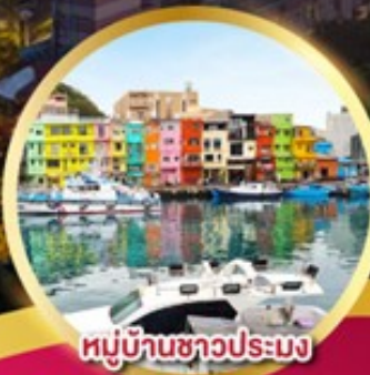
หมู่บ้านชาวประมง