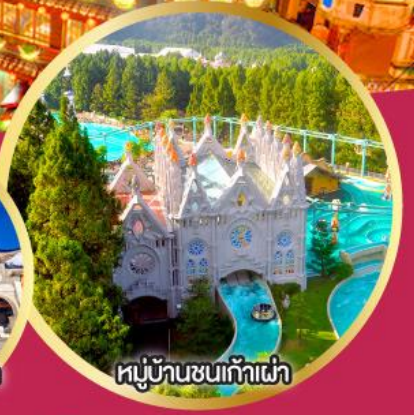
หมู่บ้านชนก้าเผ่า