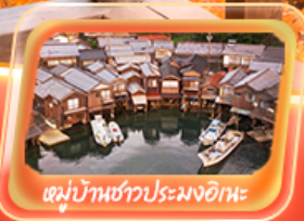
หมู่บ้านชาวประมงอิเะ