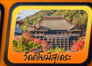
วัดคิโยมิสุเดระ