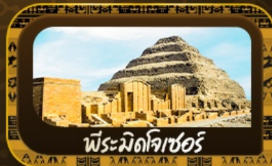
พีระมิดโจเซอร์