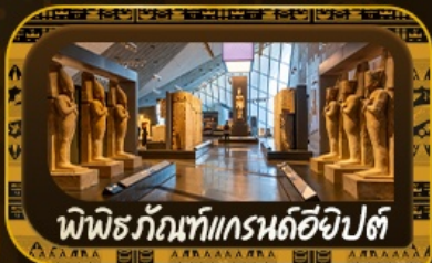
พีพีธกรันท์แกรนด์อียิปต์