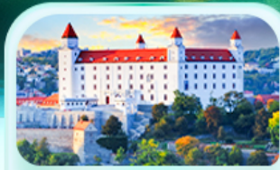
ปราสาทบราติสลาว่า

เที่ยวชมเมืองฮัลส์สตัดท์ หมู่บ้านริมทะเลสาบสวยที่สุดในโลก พระราชวังเซินบรุนน์ เมืองลินซ์ จักรีสฮาพท์พลัทซ์ สัมผัสเมืองมรดกโลก เซสท์ ครุมลอฟ เยี่ยมชมปราสาทปราก ถนนทองคำ เข็ควินสถานี่ชื่อดัง! ปราสาทบราติสลาว่า ล่องเรือชมความงามแม่น้ำดานูบ แม่น้ำที่ยาวที่สุดในยุโรป ชมความน่าหลงใหลของ ปราสาทบูดาเปสต์ สะพานชาร์ลส์