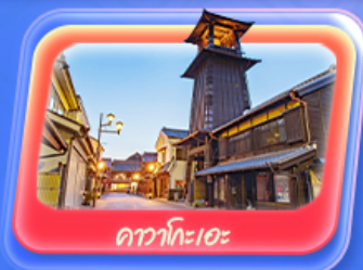
คาวาโกเอะ