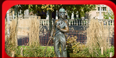
ชาร์ลี แซปลิน