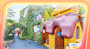
มียายามาออนเซ็น

สัมผัสกลิ่นอายญี่ปุ่นแท้ที่ศาลเจ้าดาไซฟู ของพรวัดนันโซอิน