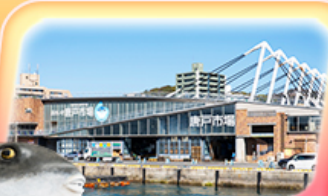
ตากาซากิออนเซ็น