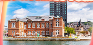
มิซึโกชิ อิเซตัน

สายการบิน Vietjet Air (VZ) น้ำหนักกระเป๋า 20 KG