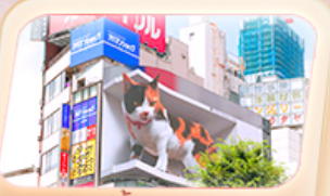
ช้อปปิ้งย่านชินจูกุ