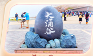
ซุบเขาโซด้าโอวาคุดานิ