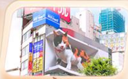
ซ็อบบิงย่านชินจูกุ