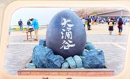
ซุบซาโด้ถ้ำอิวาคุดานิ

สายการบิน AirAsia X (XJ) น้ำหนักกระเป๋า 20 KG