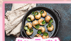
เมนูพิเศษ หอยเอสคาโท

เยอรมัน เนเธอร์แลนด์ เบลเยียม ฝรั่งเศส Keukenhof