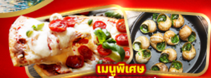
เมนูพิเศษ หอย Escargot Pizza Margherita 1 ถาด

อิตาลี มหาวังหารดูโอโม ชมสิ่งมหัศจรรย์โลก โคลอสเซียม หอเอนปิซ่า สวิส พิธีชงชาของเฟรรา "TOP OF EUROPE" สะพานไม้ชาเปล รูปปั้นสิงโต ฝรั่งเศส เข็มอินปารีส หอไอเฟล ประตูชัย นั่งรถกระเช้าไฟฟ้ามงต์มาตร์ ล่องเรือแม่น้ำแซนชมเมือง ซ้อมบิงแบร์นเดนมหำปลอดภาษี เอาท์เล็ท