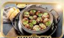
เมนูพิเศษ หอย Escargot