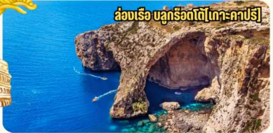
ล่องเรือ บลูกริโอตโต [เกาะคาปรี]