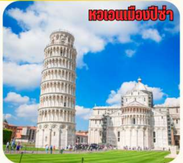
หอเอนเมืองปิซ่า