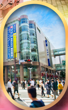
ช้อปปิ้งย่านเท็นจิน