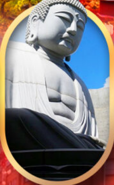
พระใหญ่อะตะมะ