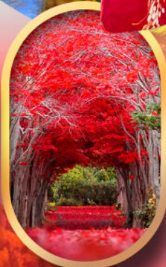
สวนฮิราโอกะ