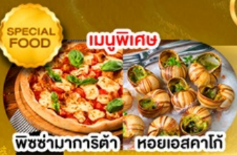
พิซซ่ามาการิตต้า หอยแอสคาโก้