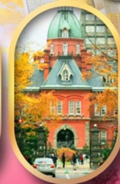
ศาลาว่าการเก่า