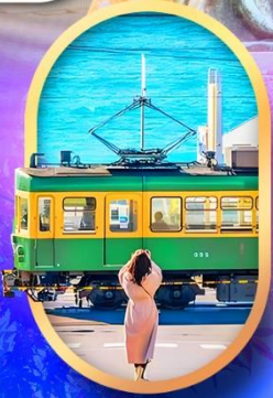
ถนนโคมาจิโดริ