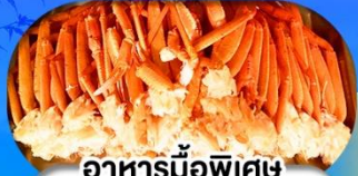
อาหารมือพิเศษ บุฟเฟ่ต์งาปู