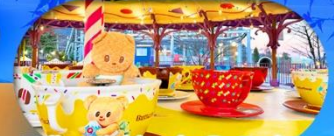
Fuji q Highland x Butterbear เดินทาง พ.ศ. 69 เป็นต้นไป