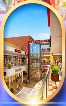
บิตซูเอาก์ลีต