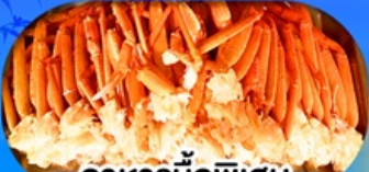
อาหารมือพิเศษ บุฟเฟ่ต์จางปู