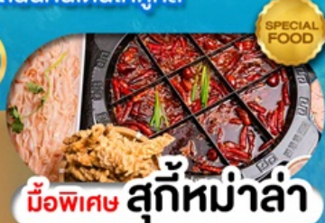
มือพิเศษ สุกี้หม่าล่า