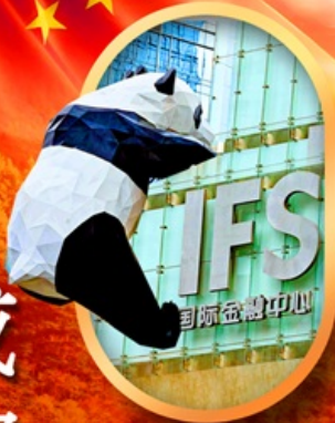
IFS หมีแพนด้าป็นติก