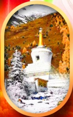
อุทยานสี่ตุ๋น