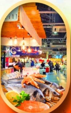
ตลาดปลาฮิดะ