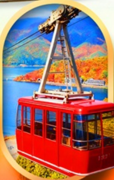
ขึ้นกระเช้าทะเลสาบมิกะตะ