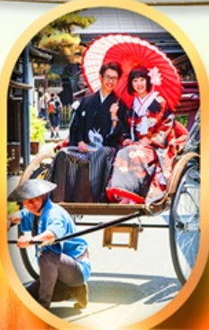
เมืองเก่าทาคายามา