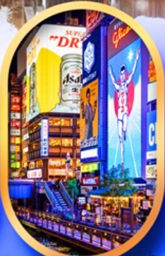
ย่านชินโซบาชิ