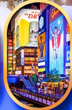
ย่านชินโซบาชิ