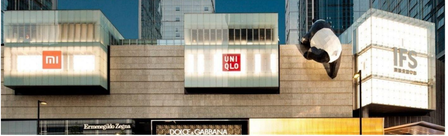
นำท่านสู่จุดเช็คอิน หมีแพนด้ายักษ์ปิ่นตึก (IFS BUILDING) แพนด้าอ้วนสุดแสนน่ารักกำลังปิ่นตึก เป็นประติมากรรมแพนด้ายักษ์ แขวนอยู่บนอาคาร IFS ใจกลางเมืองเฉิงตู มีแหล่งช้อปปิ้งมากมาย