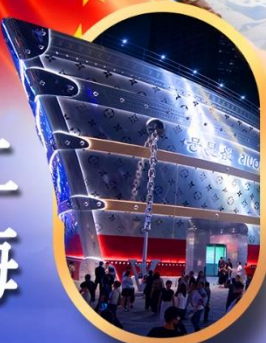
เรือคอะหลุยส์