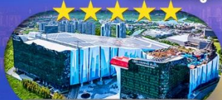
Crowne Plaza Snow World Hotel หรือเทียบเท่า ระดับ 5 ดาว 1 คืน

เชียงใหม่ ดิสนีย์แลนด์ ไอซ์แอนคส์โนวเวิลด์