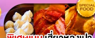
พิเศษเมนูเสี่ยวหลงเปา หมุดงพ้อ ไก่จอกาน เดินทาง ม.ค. - มิ.ย. 69