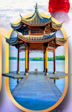
ล่องทะเลสาบซีหู