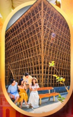
อาคารไม้ไผ่