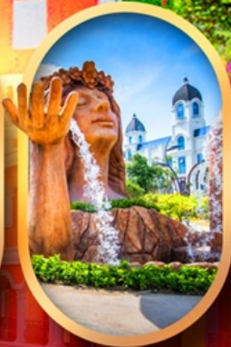
น้ำตกเทพพิหญิง