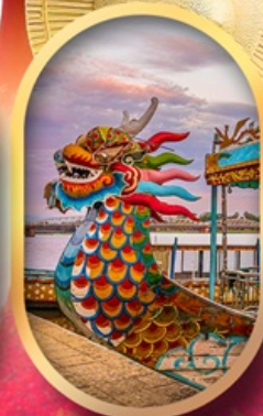
ล่องเรือมังกรแม่น้ำหอม