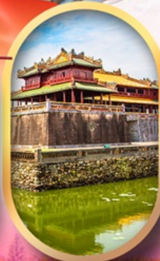
พระราชวังไคโน้ย