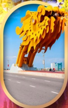
สะพานมังกรดานัง