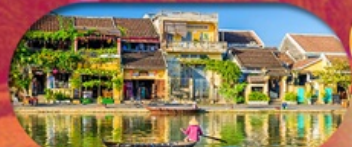
HoiAn Ancient Town ย่านเมืองเก่าฮอยอัน