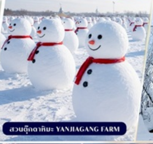
สวนตุ๊กตาหิมะ YANJIANG FARM