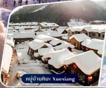
หมู่บ้านหิมะ Xuexiang

✈️ คอนเฟิร์มออกเดินทาง ตั้งแต่ 15 ท่าน ขึ้นไป