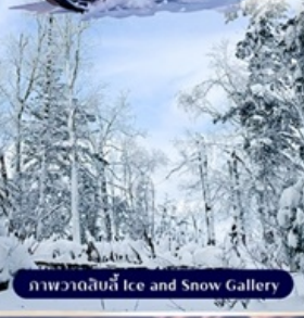
ภาพวาดด้วยน้ำแข็ง Ice and Snow Gallery