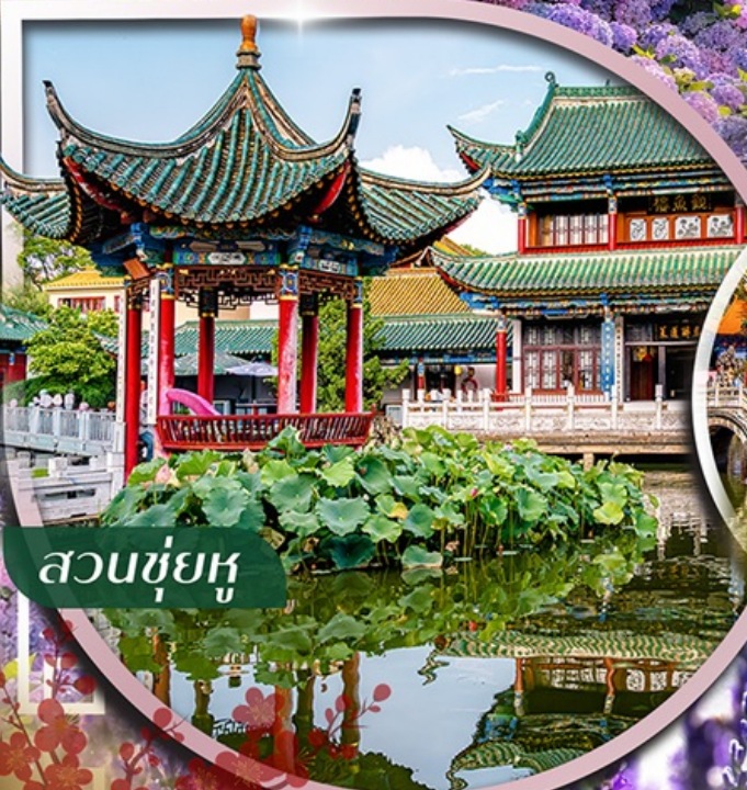
สวนชู่ฮู่