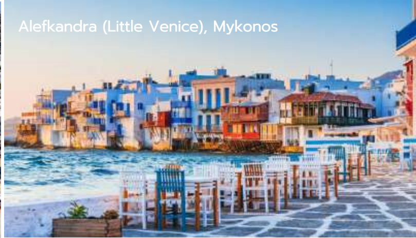
Alefkandra (Little Venice), Mykonos

นำท่านสู่ ลิตเติลเวนิส Little Venice ย่านที่สร้างขึ้นในศตวรรษที่ 18 ที่มีคฤหาสน์ของอดีต กับต้นเรือสีสดใสและร้านอาหารริมทะเลที่ดูเหมือนจะพุ่งขึ้นมาจากทะเลโดยตรง นอกจากนี้ยัง อยู่ติดกับกังหันลมบนเนินเขาอันโด่งดังของเกาะ ซึ่งเหมาะแก่การถ่ายภาพเป็นอย่างยิ่ง อิสระให้ ท่านเดินเล่นพักผ่อนตามอัธยาศัย