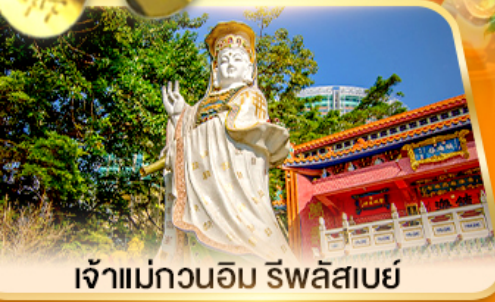
เจ้าแม่กวนอิม ธิพลสเบย์