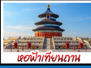
ศาลฟ้าเทียนถาน