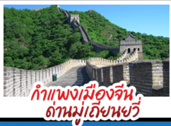
กำแพงเมืองจีน ด้านมู่เทียนยวี่

Universal Beijing - กำแพงเมืองจีนด้านมู่เทียนยวี่ (รวมกระเช้าขึ้น-ลง) พระราชวังโบราณกู้กง - หอฟ้าเทียนถาน - ซ้อมปิงกอนหวิ่งฟู่จิ้ง และซานหลี่ถุน เมมูพิเศษ สุกี่มอ้งโก, เปิดปักกิ่ง, Michelin Guide ร้าน Tao Tao Ju