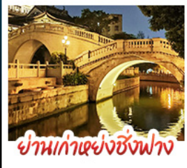
ย่านเก่าแห่งซิงฟาง