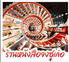
ร้านหนังสือจุงชูก่อ