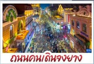
ถนนคนเดินจงยาง